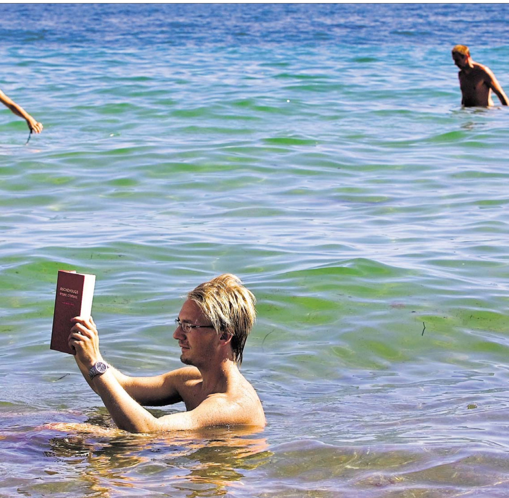
En god bog kan være svært at slippe i sommerferien.

De danske ledere har svært ved at holde pause fra jobbet. Ifølge en undersøgelse fra Lederne holder halvdelen af cheferne i de danske virksomheder ikke helt fri fra jobbet, selvom skrivebordet på arbejdspladsen er ryddet, og der står "sommerferie" i kalenderen.